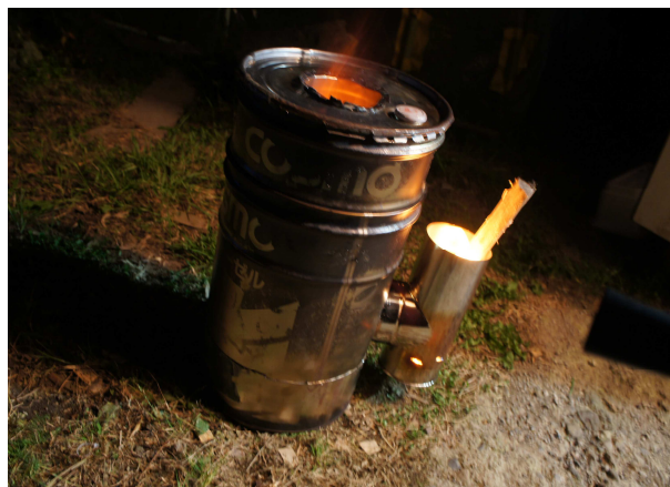
闇夜にかがやく調理用ミニストーブ