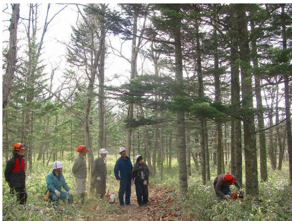
トドマツを伐る(2011年春のワークショップ)