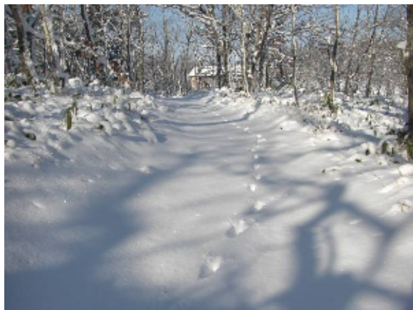
明郷森の小径 2011 新雪