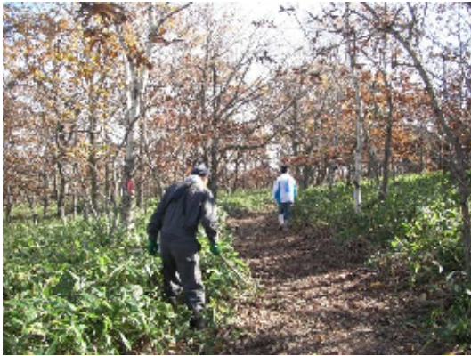
秋晴れの下こんなきもちいい道にことしも仕上げます