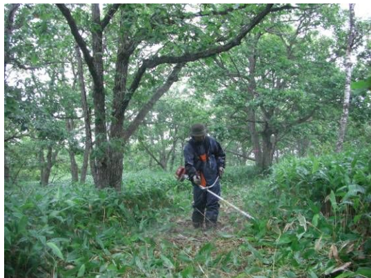
いまはむかし、ある男、雨滴る夏の森に草刈りて径つくりたり