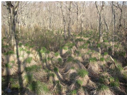
春—ヤチボウズに毛(?)が生え始める 厚床パス沿いにて