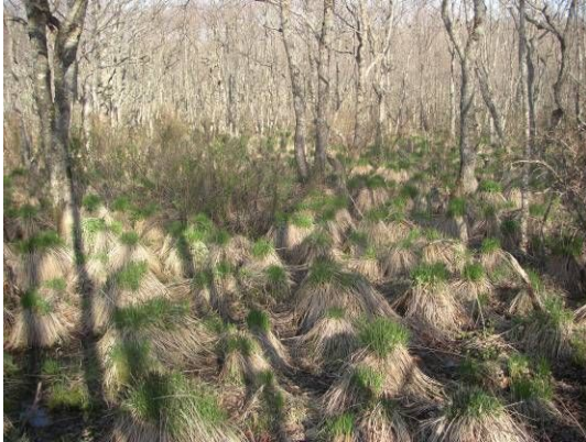
春—ヤチボウズに毛(?)が生え始める 厚床パス沿いにて