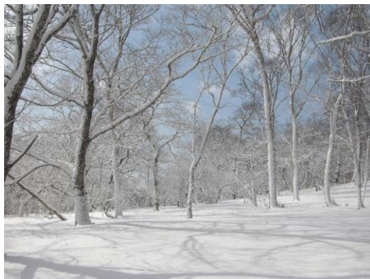
雪景色の森 ～別当賀バスにて