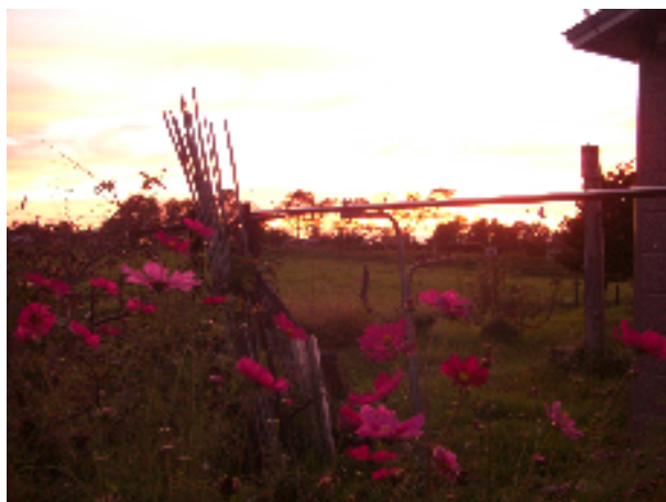
秋桜…哀愁の庭 別海町西春別