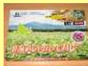
北海道じゃがいもカレー