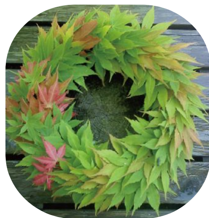
アレンジイメージ「もみじのリース」