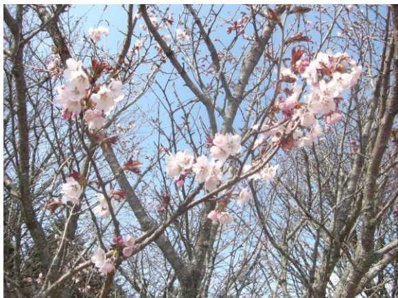
今年はいつ咲くの？ 酪農喫茶前のサクラ