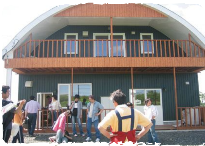
▲農産物加工体験館「食多楽（くったら）」